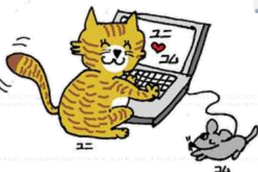
「スマホ講習会」(新宿図書センター)