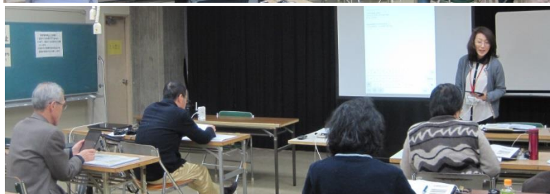
「iPad活用講座アンコール」(新宿図書センター)