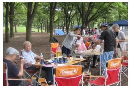
⇒ シニアド養成講座