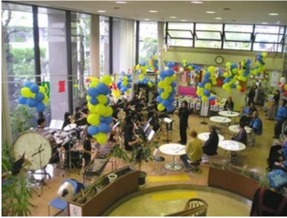
オープニング演奏：葛飾吹奏楽団ジュニアバンド

今年は「発見！ひとの絆と元気がかつしか」のキャッチコピーのもとに、40ほどの団体が参加、さまざまな活動紹介、イベント、ステージ、野外模擬店などで終日賑わった。