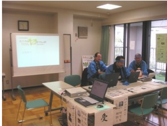
ユニコム開店休業？ いえいえこれは開場前。

ユニコムかつしかでは、各団体紹介パネルを展示した2階の多目的室にブースで、パソコン何でも相談やネーム入り缶バッジの作成などを行った。ただ、残念なことに2階まで来る入場者がそれほど多くなく、対応メンバーは手持ち無沙汰の感もあった。