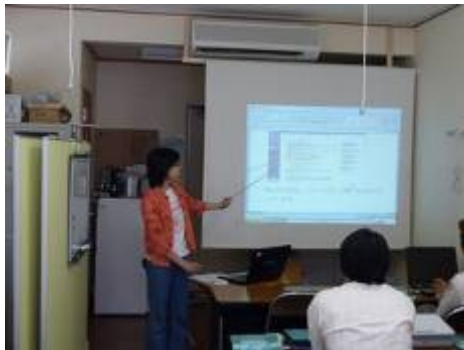
認定試験（プレゼンテーション科目）

また、どうしても出られない母親のために息子さんや代役で講座に出席という事態も出来事もあった。2ヶ月に及ぶ長い講習会のため、どうしても時間の都合がとれずに途中で欠けていく人もいて、最終的には9名の方が最後まで残って7月末の認定試験を受けた。いずれも熱心で意欲的な方々だったので、講師や事務方もやりがいのある講座だった。