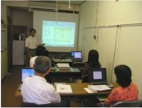
認定試験（プレゼンテーション科目）

無事合格された暁には、地域社会に参加してシニアの方たちにパソコンを利用するの楽しさ・便利さ・面白さを伝えてもらうことが、このシニア情報生活アドバイザーの役目である。