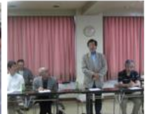
シニアド養成講座合格者