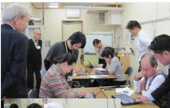
ユニコムかつしか 立石事務所会場 11月11日

Win8 の最大の特長は、タブレット端末で注目されているタッチパネルに対応するために新しいスタイル画面を全面的に採用し、同時に従来のデスクトップ画面にも対応できるようにしたこと。