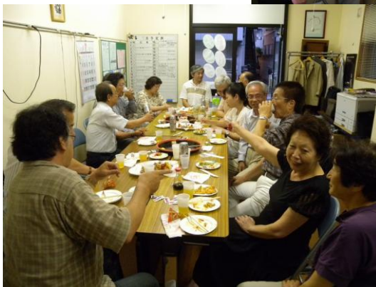
第15期シニア情報生活アドバイザー懇親会風景